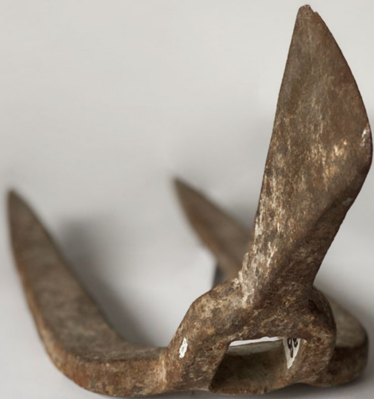
Arpiots Peça del Museu Comarcal de Berga amb registre n.ºm. 619