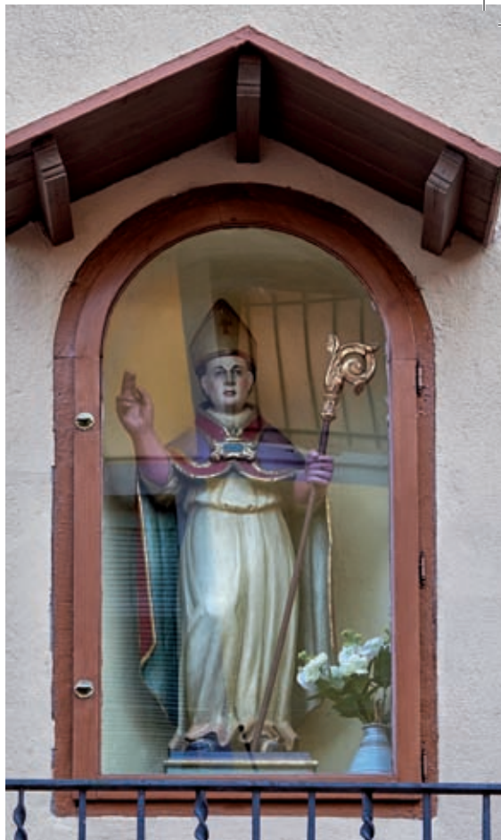
Capella de Sant Eloi a la plaça de Santa Magdalena de Berga. 2018.

Vegem, ara, alguns dels oficis integrats en el gremi d'Els Elois de Berga.