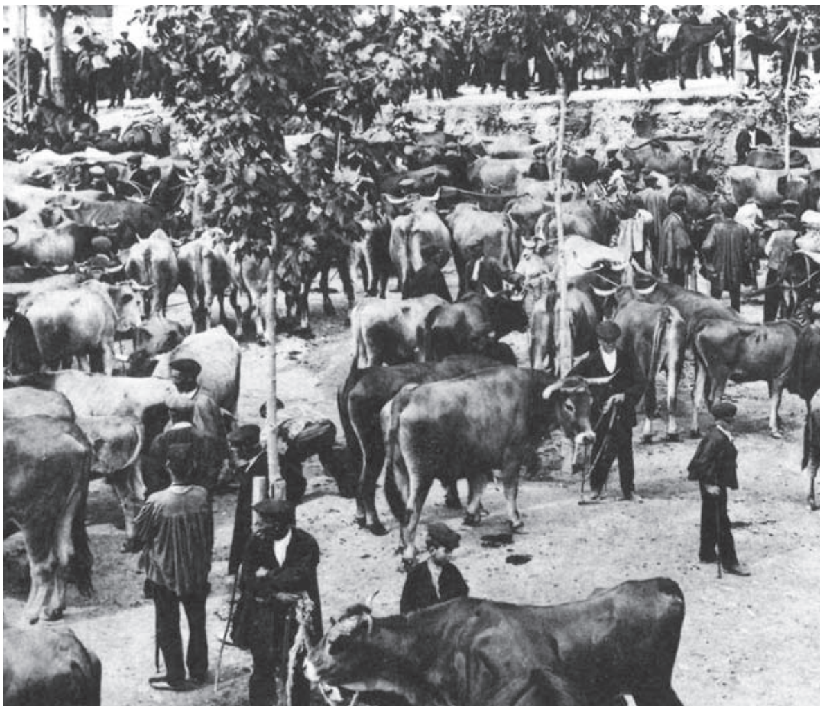
Fira de bestiar al Vall de Berga. Anys 20 del segle XX.