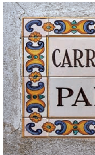
Els paraires preparaven la llana per a ser treballada. 2018.