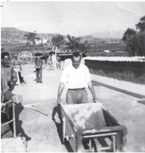
Una jornada de treball a la teuleria de Cal Bassacs (Gironella). Dècada dels anys 50 del segle XX.

Els rajolers i teulers treballaven el fang però no empraven el torn, sinó motlles. Les peces que fabricaven servien per a la construcció i eren bàsicament rajoles, totxos, cairons i teules. Al Berguedà, una de les teuleries més importants era la teuleria de Cal Bassacs. A l'hivern, s'anava als terrers a proveir-se d'argiles, que es portaven amb un carro a la teuleria, on es preparaven per ser treballades. A la primavera, amb el bon temps, es començaven a fabricar les peces. S'agafaven porcions d'argila humida i es posaven dins uns motlles de fusta que tenien la forma de la peça que es volia obtenir. Amb la mà o un llistó s'eliminava el fang sobrer, es treia el motlle i les peces quedaven situades a terra, l'una al costat de l'altra, en una zona plana anomenada "la plaça" i allà restaven tres o quatre dies fins que s'havien assecat una mica. Llavors es treien i s'enrimaven (s'arrimaven) dins uns coberts on circulava l'aire per tal que s'acabessin d'assecar.