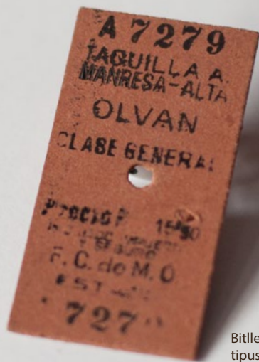
Bitllet de tren tipus Edmonson Cedit per Casa Museu Teixidor - Bassacs de Gironella