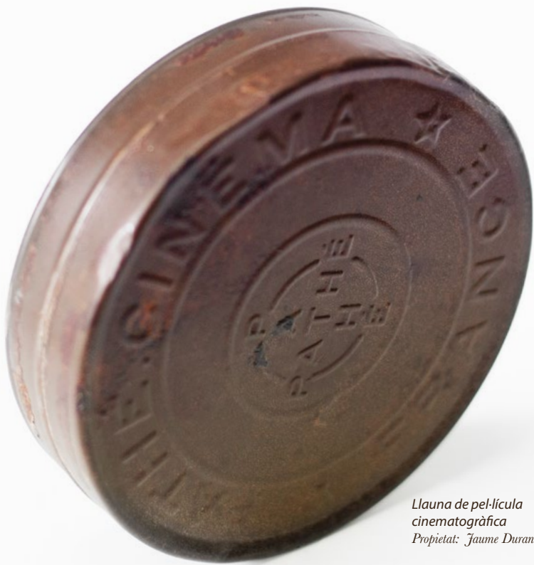
Llauna de pel·lícula cinematogràfica Propietat: Jaume Duran Castells